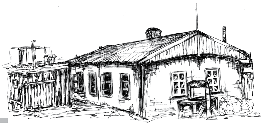
Kaplica w Karagandzie – istniała rok (1956/1957).