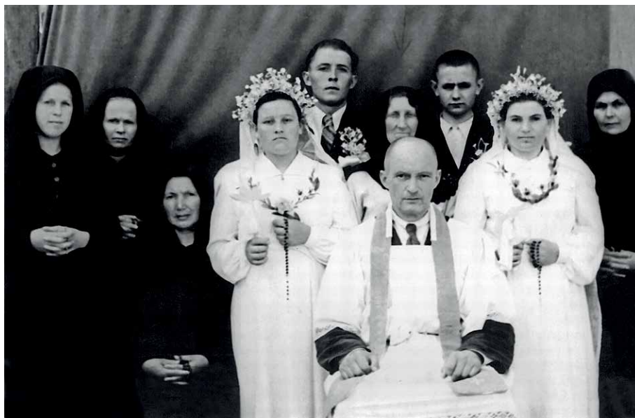
Sakrament małżeństwa w rodzinach Niemców z Karagandy, 1957 r.

Wykładał w Seminarium Duchownym w Łucku, był zaangażowany w działalność Akcji Katolickiej. Kiedy wybuchła wojna został proboszczem katedry łuckiej. Rok później za pomoc udzielaną wywożonym na Sybir rodakom został aresztowany przez Sowieców i skazany na osiem lat więzienia. W czerwcu 1941 r. cudem uniknął śmierci w czasie likwidacji łuckiego więzienia przez NKWD. Stał