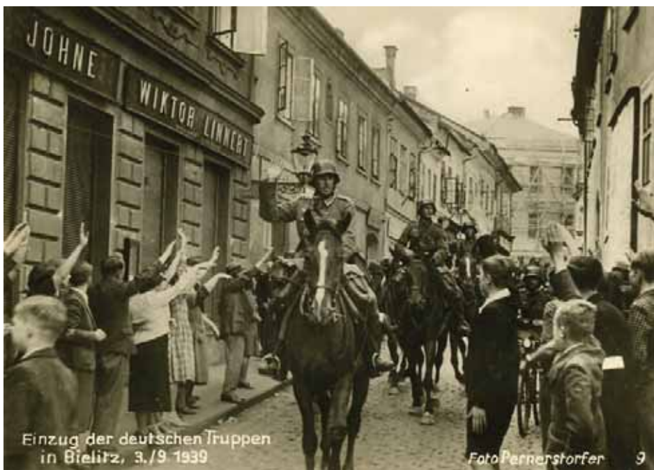
Żołnierze Wehrmachtu wkraczają 3 września 1939 r. do Bielska witani przez niemieckich mieszkańców miasta. Zdjęcie z niemieckiego albumu „Bielitz. Unsere Heimat ist wieder Deutsch” (AIPN, Zbiór fotografii GK, nr inw. 22118)