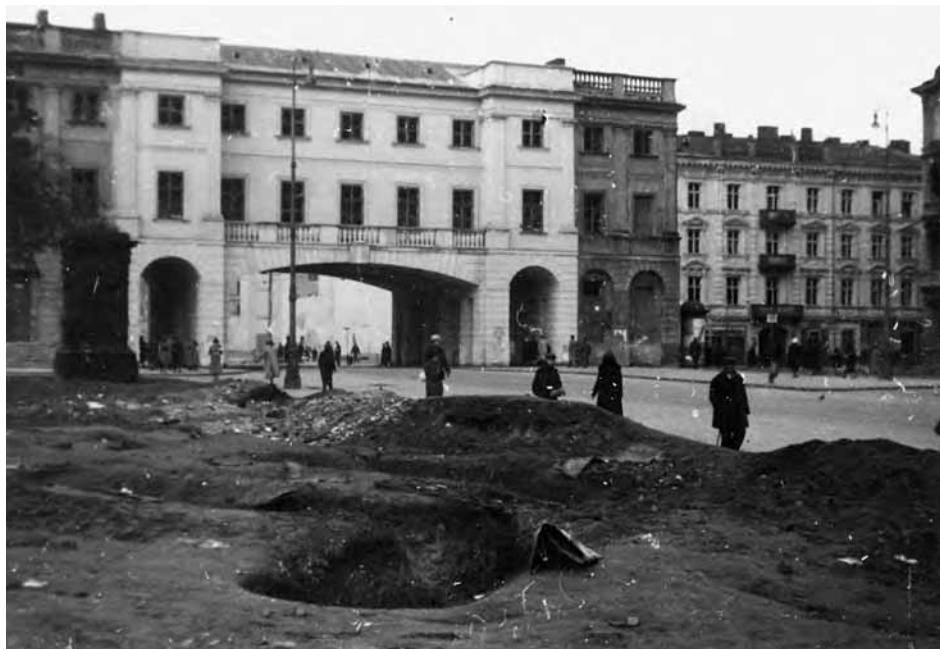
Północny fragment placu Krasińskich w Warszawie z rowami przeciwlotniczymi na trawniku przed pałacem Krasińskich oraz przechodnie. Pośrodku budynek Sądu Okręgowego w Warszawie (pl. Krasińskich 12).