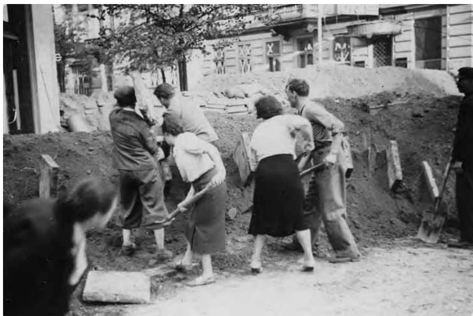
Mieszkańcy Warszawy we wrześniu 1939 r. przy budowie barykady na ul. Nowogrodzkiej, u zbiegu z ul. Marszałkowską. Zdjęcie wykonane przez Juliana Bryana (AIPN, 2353/4/1)