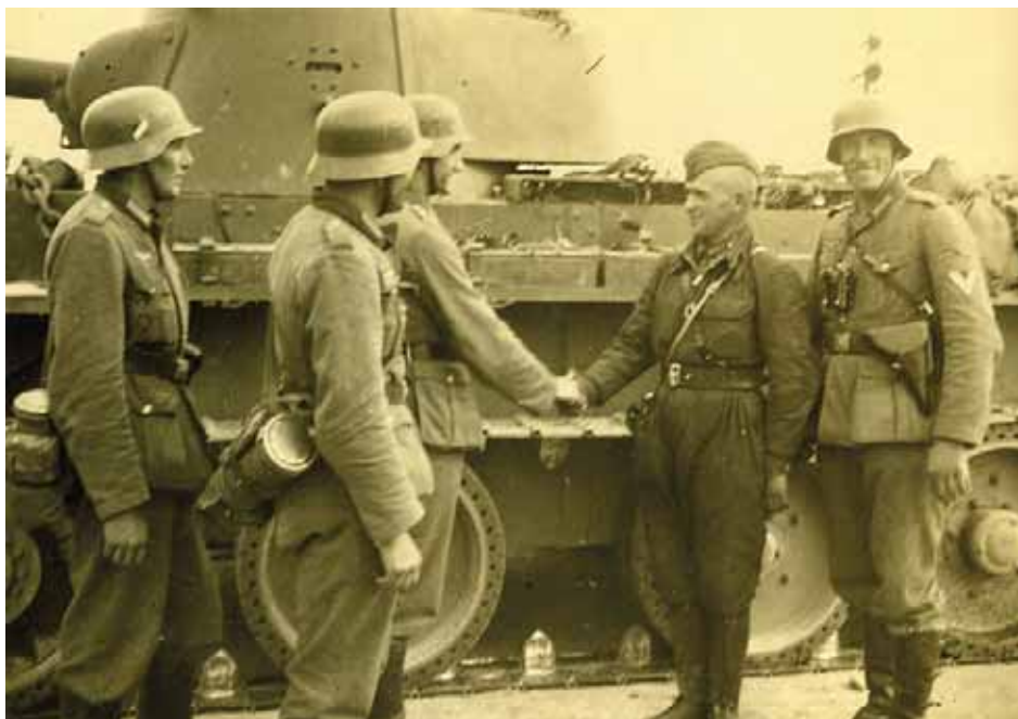
Grupa żołnierzy niemieckich z 1. kompanii 13. pułku strzelców 5. Dywizji Pancernej wita czołgistę Armii Czerwonej na drodze w okolicy miasta Stryj. Zdjęcie z albumu pamiątkowego 1. kompanii 13. pułku strzelców 5. Dywizji Pancernej „Feldzug Polen”