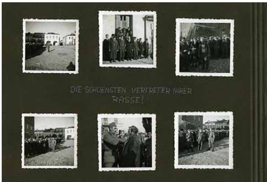
Karta nr 38 z albumu Ottmara Kreisela podpisana „Najpiękniejsi przedstawiciele swojej rasy!”. Na zdjęciach widać represje niemieckie w stosunku do ludności żydowskiej w nieustalonym polskim mieście