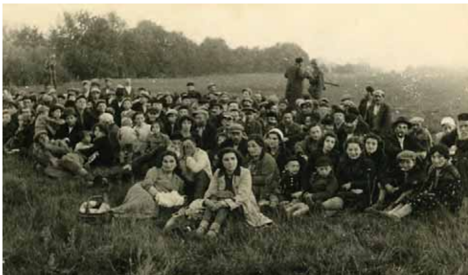
Spędzeni przez Niemców Żydzi z Przedborza. Autor nieznany, zdjęcie niemieckie znalezione w 1945 r. w poniemieckim domu w Sosnowcu (AIPN, Zbiór fotografii GK, nr inw. 19447)