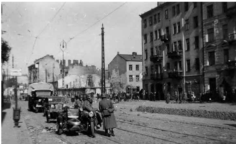
Pojazdy jednostki policji niemieckiej wkraczającej do Warszawy zaraz po kapitulacji miasta na ulicy Okopowej – widok z rogu ulic Okopowej i Chłodnej.