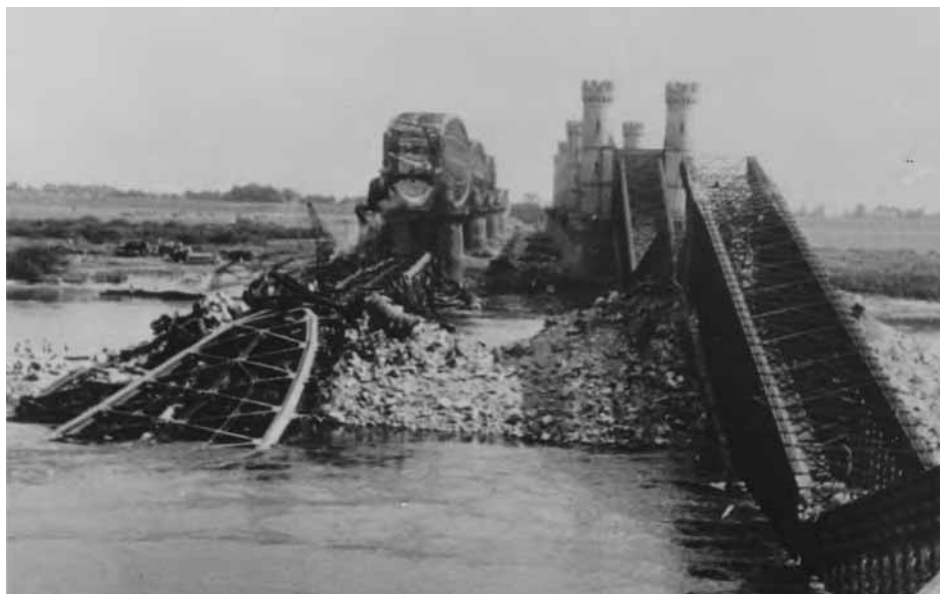
Wysadzone 1 września 1939 r. przez polskich saperów mosty na Wiśle w Tczewie. Po lewej most północny (kolejowy), po prawej most południowy (drogowy).