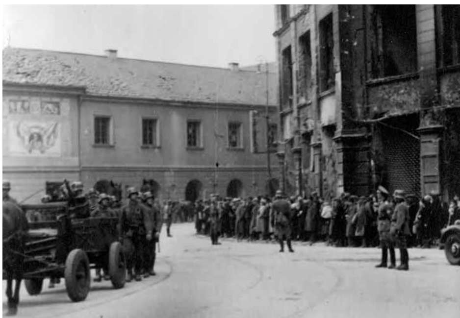
Wkraczający do Warszawy oddział wojsk niemieckich skręca w ulicę Bielańską – widok z rogu ulic Bielańskiej i Długiej.