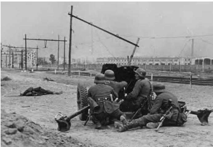
Niemieckie działo przeciwpancerne Pak 36 ostrzeliwuje polskie pozycje podczas niemieckiego natarcia na podwarszawskie Włochy.