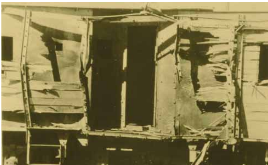
Wagon niemieckiego pociągu pancernego zniszczonego we wrześniu 1939 r. przez polską obronę pod Chojnicami. Zdjęcie ze zbiorów NARA (AIPN, 2196/20/2)