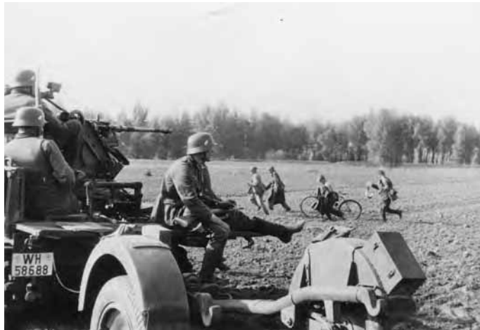
Niemieckie samobieżne działo przeciwlotnicze Sd.Kfz. 10/4 z 4. Dywizji Pancernej podczas walk o Kamion koło Wyszogrodu.