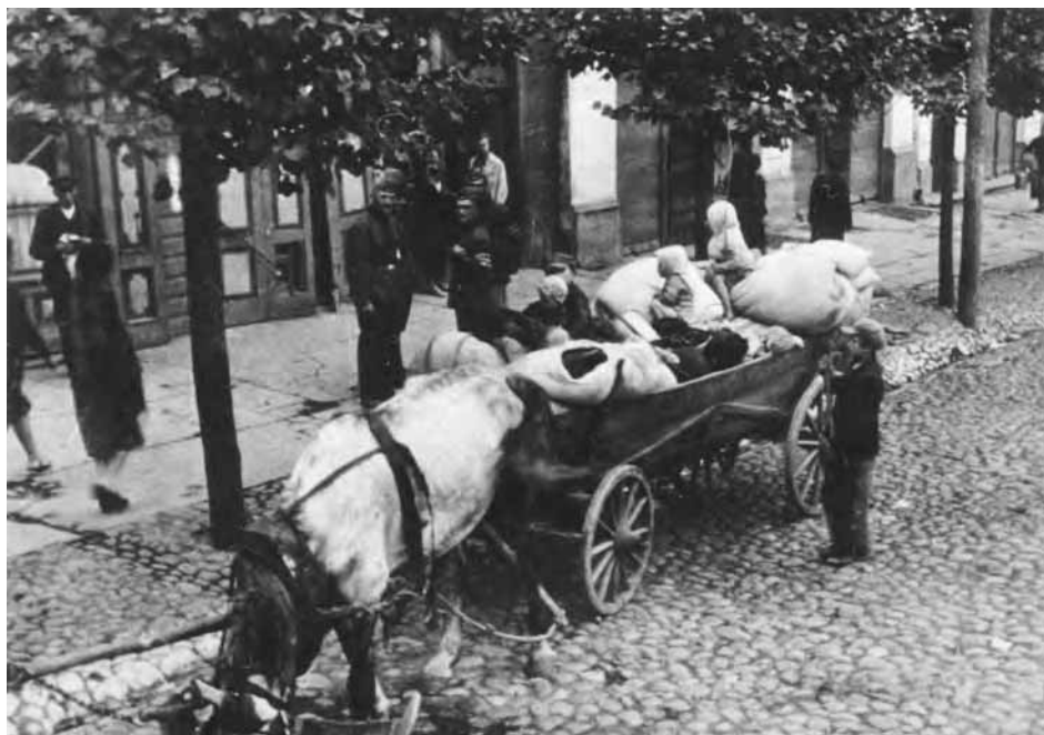
Furmanka z cywilnymi uchodźcami na ulicy Mławy zajętej we wrześniu 1939 r. przez wojska niemieckie. Zdjęcie ze zbiorów NARA (AIPN, 2196/51)