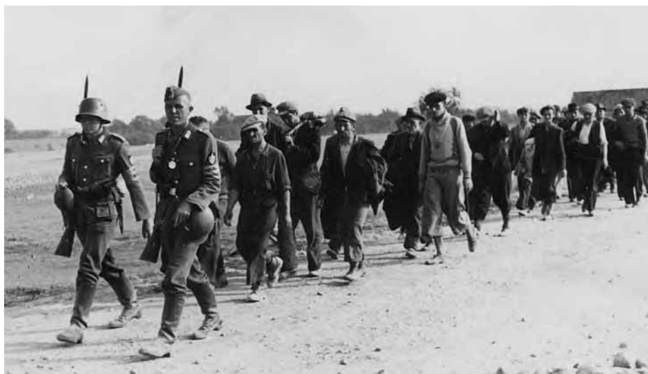
Członkowie Służby Pracy Rzeszy (Reicharbeitsdienst, RAD) eskortują grupę zatrzymanych Polaków we wrześniu 1939 r.