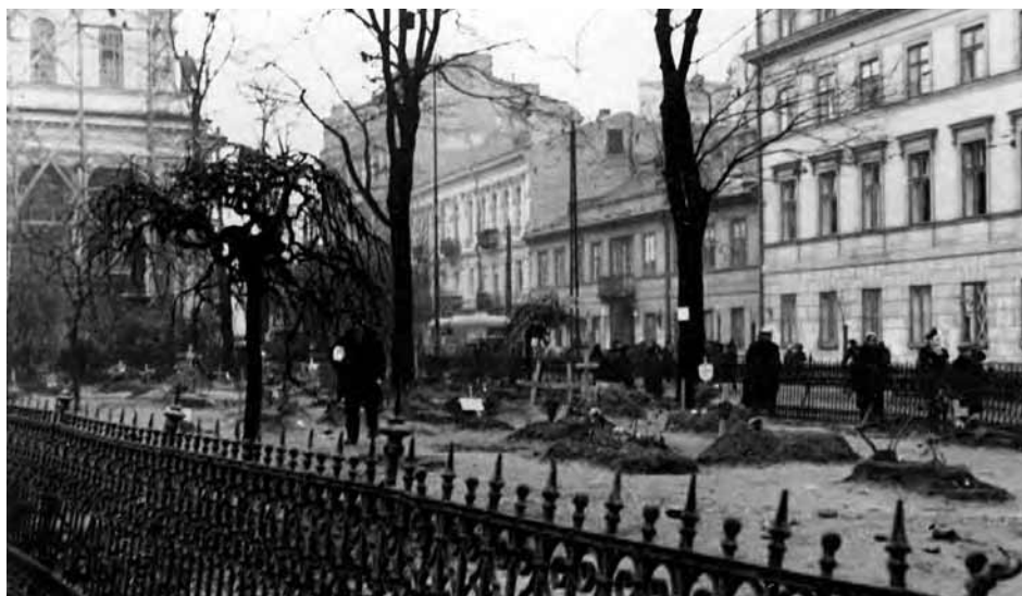
Prowizoryczny cmentarz osób zmarłych podczas walk o Warszawę na skwerze na ul. Chłodnej, przed kościołem pw. św. Karola Boromeusza.