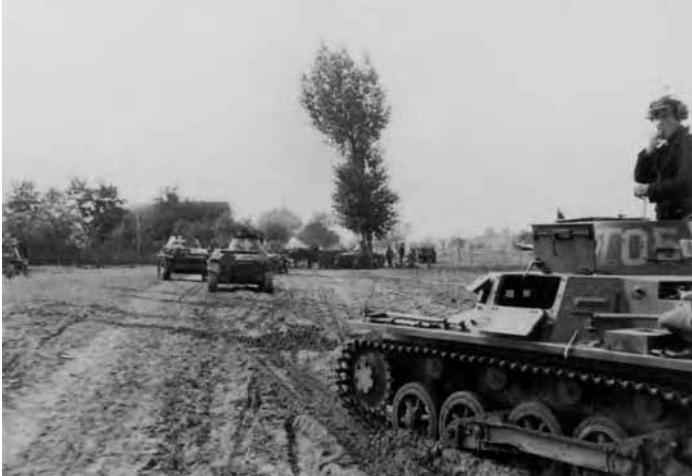
Czołgi niemieckie z 4. Dywizji Pancernej na drodze podczas walk we wrześniu 1939 r. o Kamion koło Wyszogrodu.