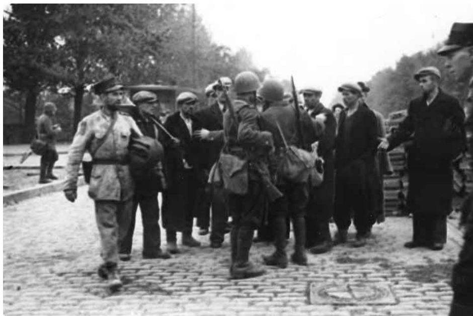
Żołnierze polscy i grupa mężczyzn na placu Weteranów 1863 w Warszawie.