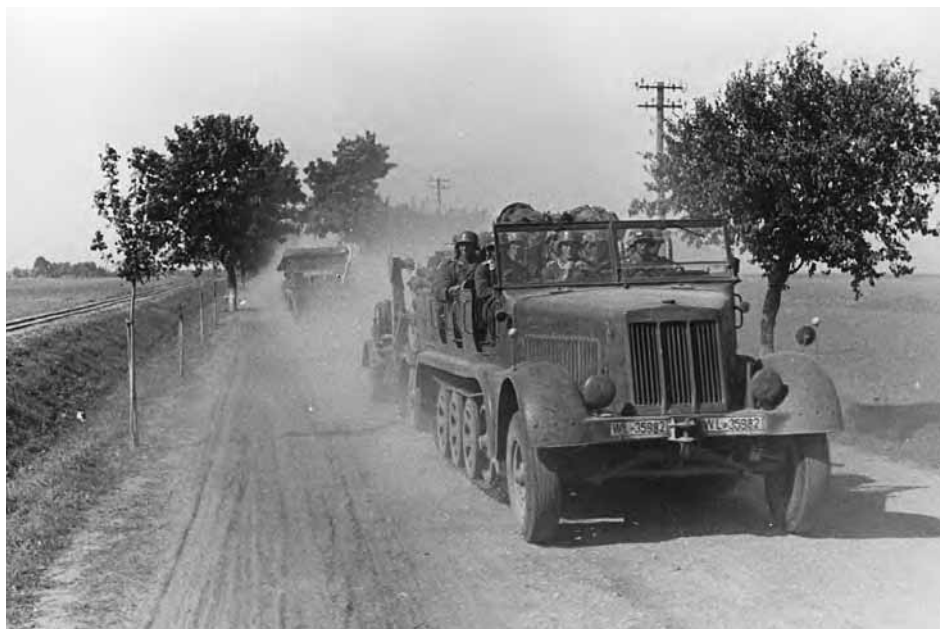
Marsz niemieckiej zmotoryzowanej jednostki artylerii przeciwlotniczej drogą Ciechanów – Pułtusk 6 września 1939 r. Zdjęcie propagandowe z albumu „Kriegsdokumente Selbständiger Luftwaffenpropagandazug Ostpreussen Herbst 1939 [cz.] II”