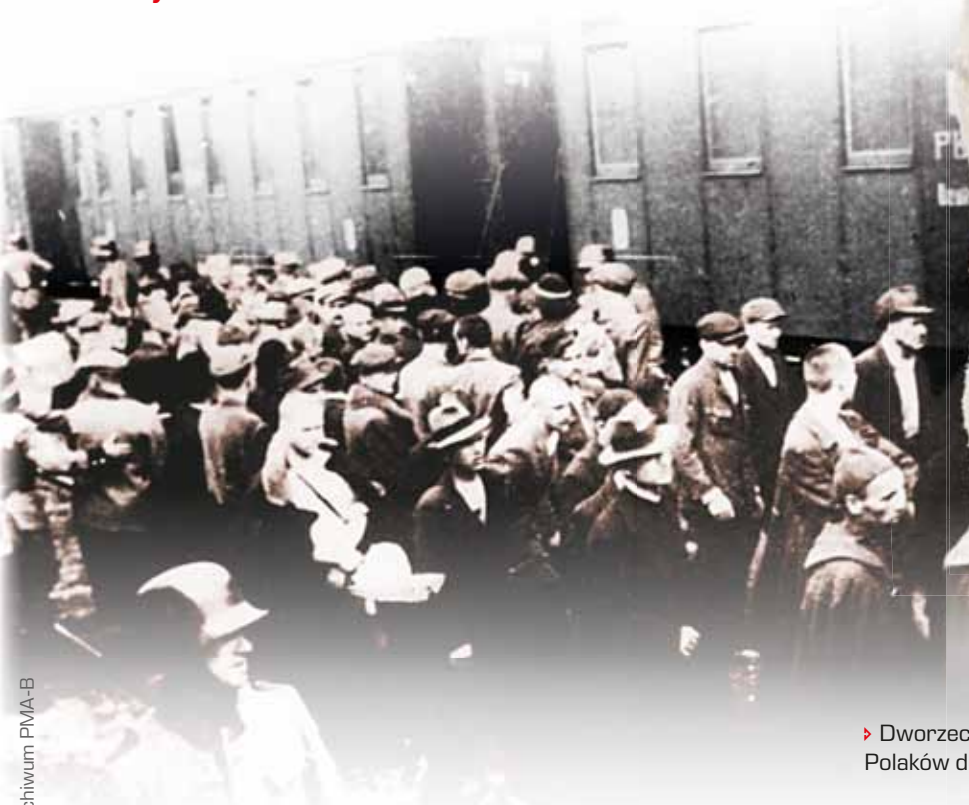
► Dworzec kolejowy w Tarnowie, pierwszy transport Polaków do KL Auschwitz, 14 czerwca 1940 roku

14 czerwca 1940 roku przywieziono do KL Auschwitz pierwszy transport polskich więźniów politycznych; z więzienia w Tarnowie przybyło łącznie 728 osób. Datę tę przyjmuje się jako początek funkcjonowania obozu. Od 2006 roku, na mocy uchwały sejmu, obchodzimy w tym dniu Narodowy Dzień Pamięci Ofiar Nazistowskich Obozów Koncentracyjnych.