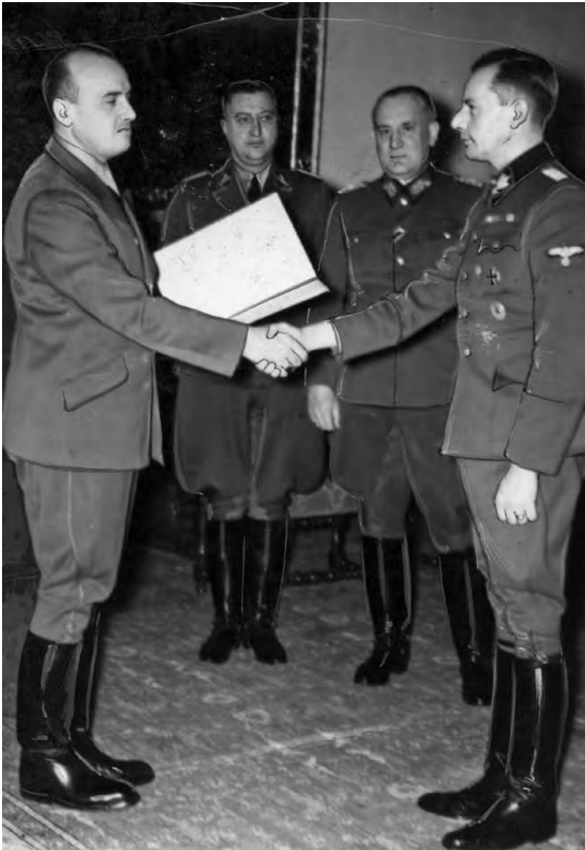
► Hans Frank (z lewej) wręcza Krügerowi nominację na szefa policji Generalnego Gubernatorstwa; Kraków, kwiecień 1941 roku

AB, przeprowadzonej w 1940 roku, kilka tysięcy wybitnych jej przedstawicieli. Za jego to rządów zbudowane zostały obozy śmierci w Bełżcu, Majdanku, Sobiborze i Treblince, dokonano zagłady ludności żydowskiej i przystąpiono do zakrojonego na szeroką skalę mordowania Polaków, zabijanych w ulicznych egzekucjach, w obozach koncentracyjnych, w lochach aresztów i więzień. To on zwierzchnio kierował zbrodniczą akcją wysiedleńczo-pacyfikacyjną na Zamojszczyźnie, która,