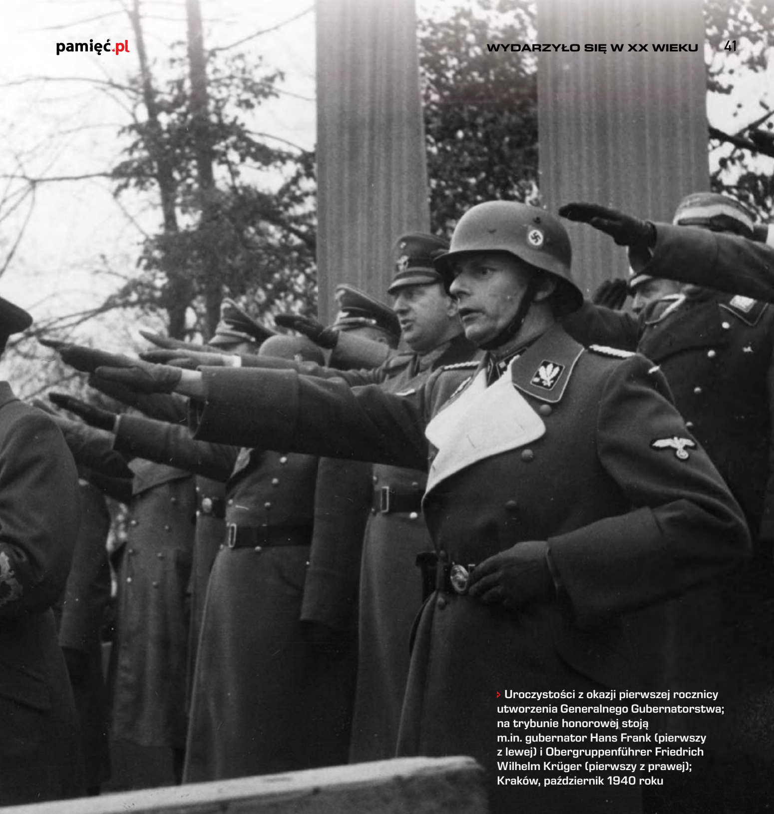
► Uroczystości z okazji pierwszej rocznicy utworzenia Generalnego Gubernatorstwa; na trybunie honorowej stoją m.in. gubernator Hans Frank (pierwszy z lewej) i Obergruppenführer Friedrich Wilhelm Krüger (pierwszy z prawej); Kraków, październik 1940 roku