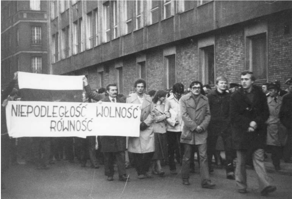
Manifestacja 11 listopada 1979 r. w Gdańsku. Manifestanci maszerują z kościoła Mariackiego w Gdańsku pod pomnik króla Jana III Sobieskiego. Na fotografii widoczny m.in. Lech Wałęsa. Zdjęcie operacyjne SB.