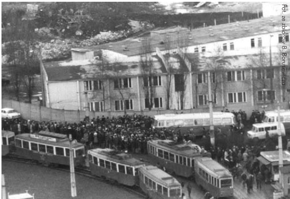
18 grudnia 1979 r. Składanie wieńców pod bramą nr 2 Stoczni Gdańskiej im. Lenina. Tadeusz Szczepański był wówczas pod stoczną z kwiatami