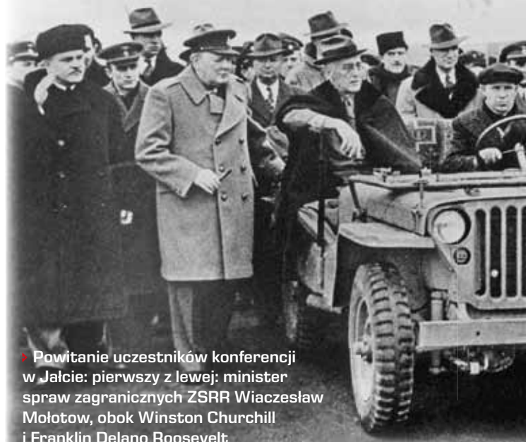
► Powitanie uczestników konferencji w Jałcie: pierwszy z lewej: minister spraw zagranicznych ZSRR Wiczesław Mołotow, obok Winston Churchill i Franklin Delano Roosevelt (w samochodzie); Jałta, 4 lutego 1945 roku

Aby walczyć o sprawę polską, w takim kształcie, w jakim byśmy chcieli, lecz w układzie sił z końca 1944 roku, mocarstwa anglosaskie musiałyby podjąć grę ocierającą się o ryzyko wywołania III wojny światowej. A przekonanie społeczeństw zachodnich do tego, by stoczyć jeszcze jedną wojnę, tym razem przeciwko dotychczasowemu sojusznikowi, Sowietom – było niemożliwe. W tych warunkach Churchill miał taką alternatywę: albo nie uczestniczyć w konferencji jałtańskiej i – tym samym – wykluczyć